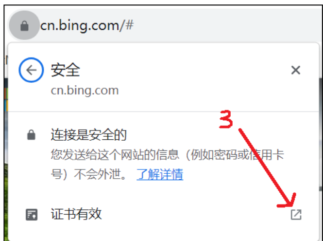
图 3-2. 服务商网站导出证书 2

点击“证书有效”一栏右侧“箭头”符号，会进入 图 3-3. 服务商网站导出证书 界面。