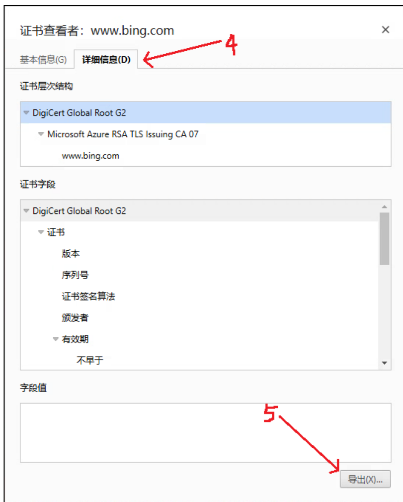
图 3-3. 服务商网站导出证书 3

先点击界面上方“详细信息”，然后点击右下方“导出”，进入 图 3-4. 服务商网站导出证书 4 界面。